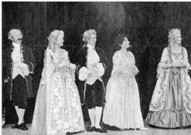
Das hat man einst am Hof Herzog Carl Eugens geliebt, auch in Urach.

»Unser Bestreben ist es, in den Räumen mit historischem Ambiente ein besseres Kulturerbe zu vermitteln.« Zur Konzeption speziell für das Uracher Schloss erklärte sie das Ziel dieser Veranstaltung: »Sie dient der Wiederbelebung