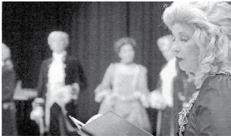
Ein Blick in vergangene Zeiten: Im Bad Uracher Schloss können man Historik im Höfen erleben.