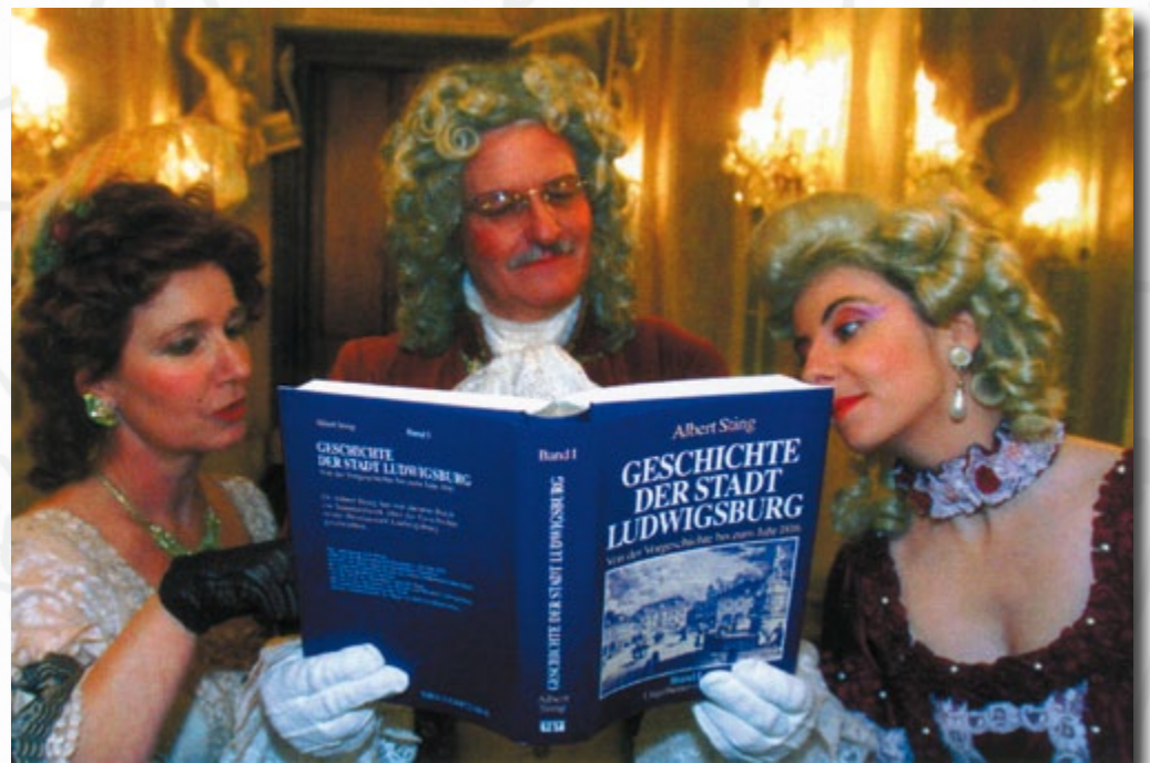
Die Bilder entstanden bei einer Buchpräsentation der Ludwigsburger Kreiszeitung beim Empfang der Gäste und beim Tanz im Ordenssaal des Ludwigsburger Schlosses.