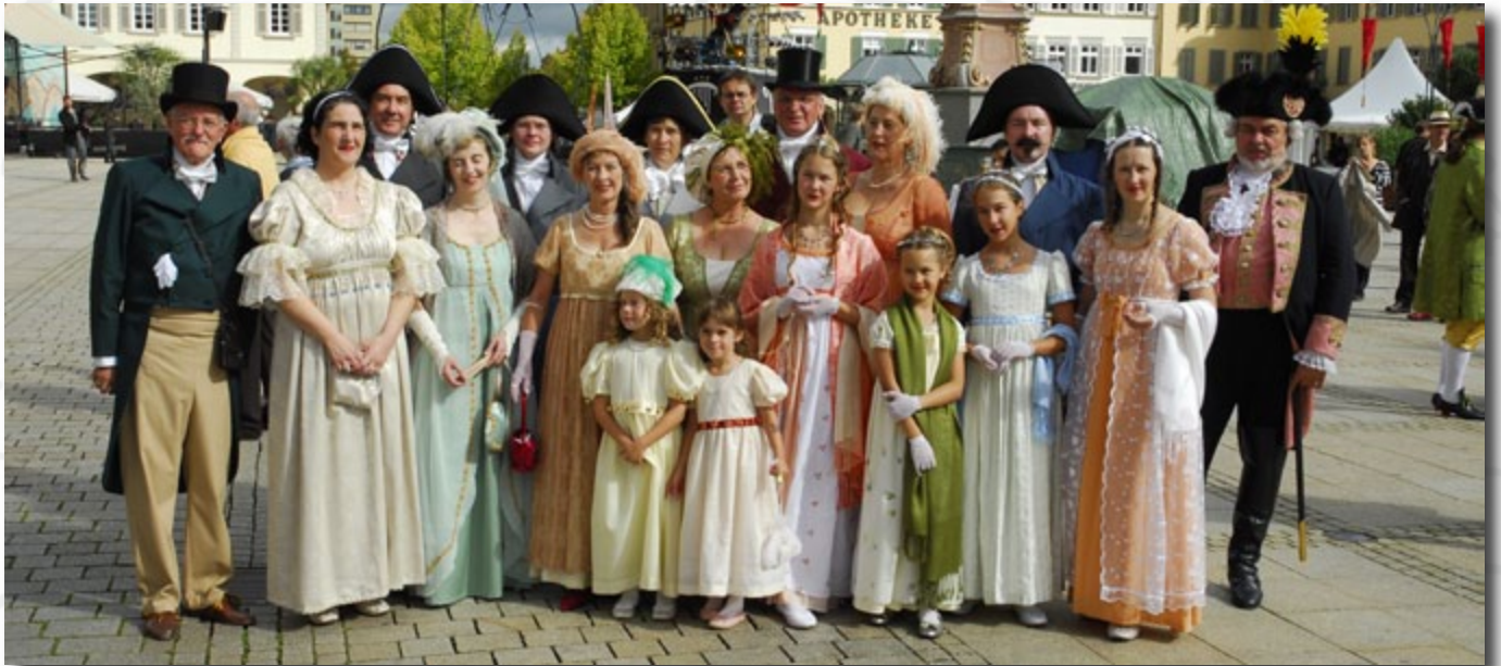
Auftritt auf der Venezianischen Messe in Ludwigsburg im Jahr 2008