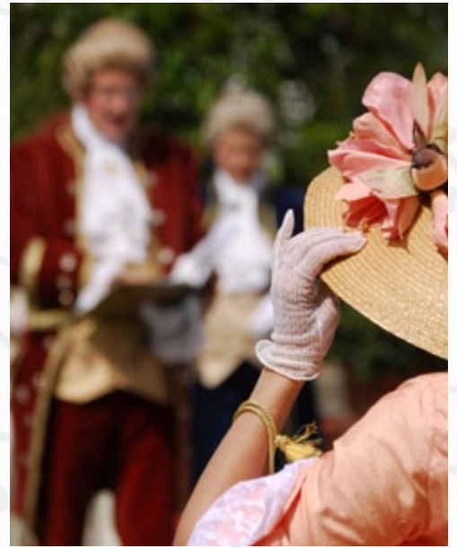
Auftritt anlässlich des 175-jährigen Jubiläums des ZfP Winnenden am 19. Juli 2009